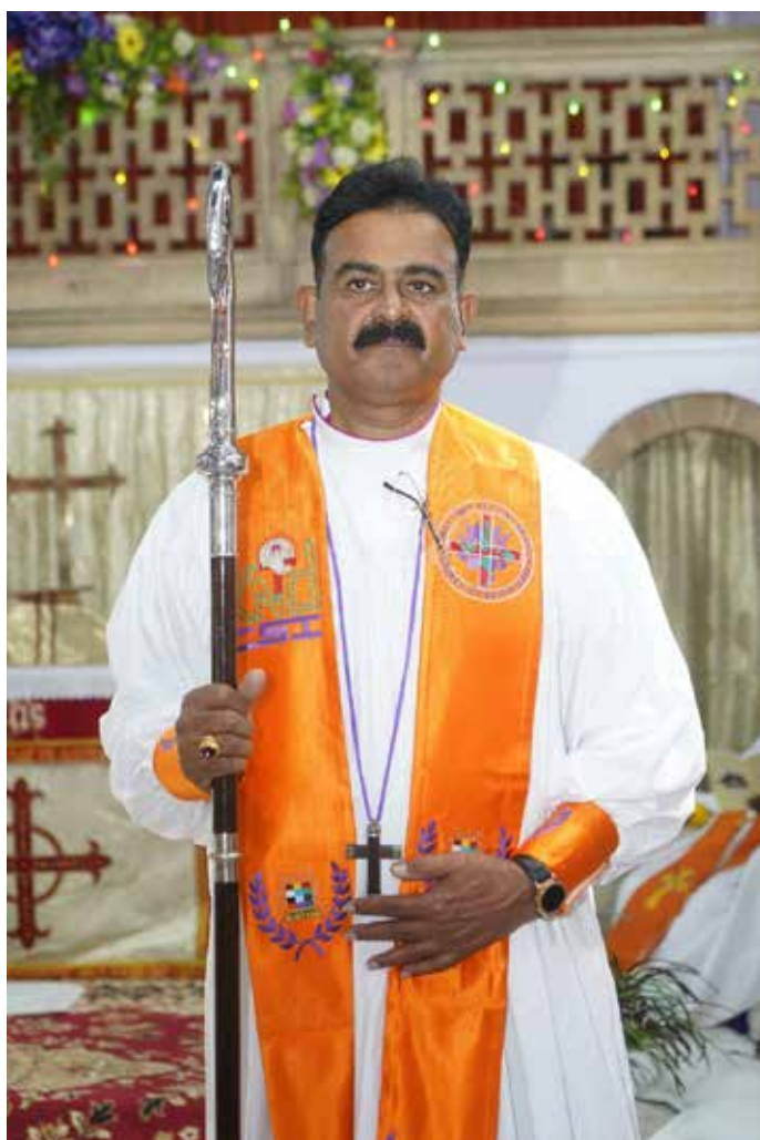
Bischof Martin Borgai